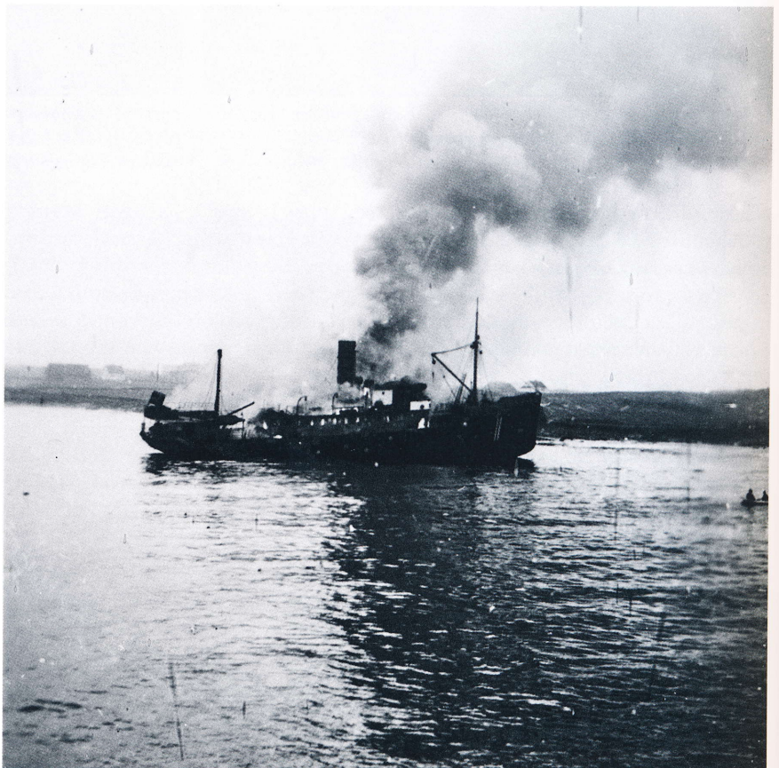
Stavangerskes "Vestri" står på grunn og brenner ut etter å ha blitt truffet av to bomber. 4 mann omkom.

Vraket brant helt ut. Det ble gjort et forgjeves bergingsforsøk. Senere i krigen benyttet tyskerne vraket som mål for øvelsesskyting. Vraket ble etter krigen delvis hogd opp på stedet av Stavanger Skipsopphugning, men noen rester skal være tilbake inne ved stranden.